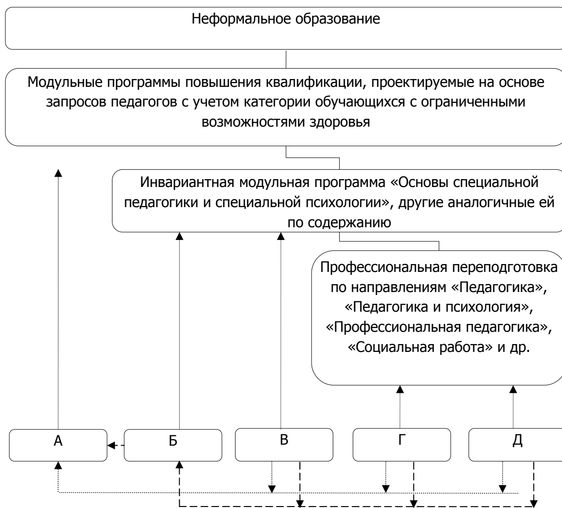
Рис. 2. Модель непрерывного образования педагогов, обучающих лиц с ограниченными возможностями здоровья. Условные обозначения: образовательный уровень педагогов, обучающихся лиц с ОВЗ

Модульно-компетентностный подход позволяет четко выделить компетенции в области обучения лиц с ОВЗ, подлежащие формированию, и на этой основе определить инвариантное и вариативное содержание учебного материала в рамках дифференцированных учебных модулей. В то же время инвариантный модуль в условиях постоянного обогащения междисциплинарного знания о биопсихосоциальных причинах, механизмах, структуре ограничений в здоровье, динамике развития и реабилитационном потенциале разных категорий лиц с ОВЗ обладает лишь относительной инвариантностью: его содержание и объем могут и должны дополняться и обогащаться с учетом новых научных достижений и результатов практико-ориентированных исследований в области специального образования.