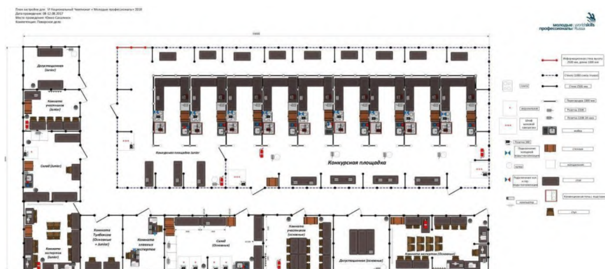
Схема конкурсной площадки (см. иллюстрацию).