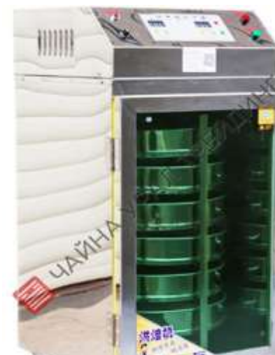
TOPONE food dehydrator