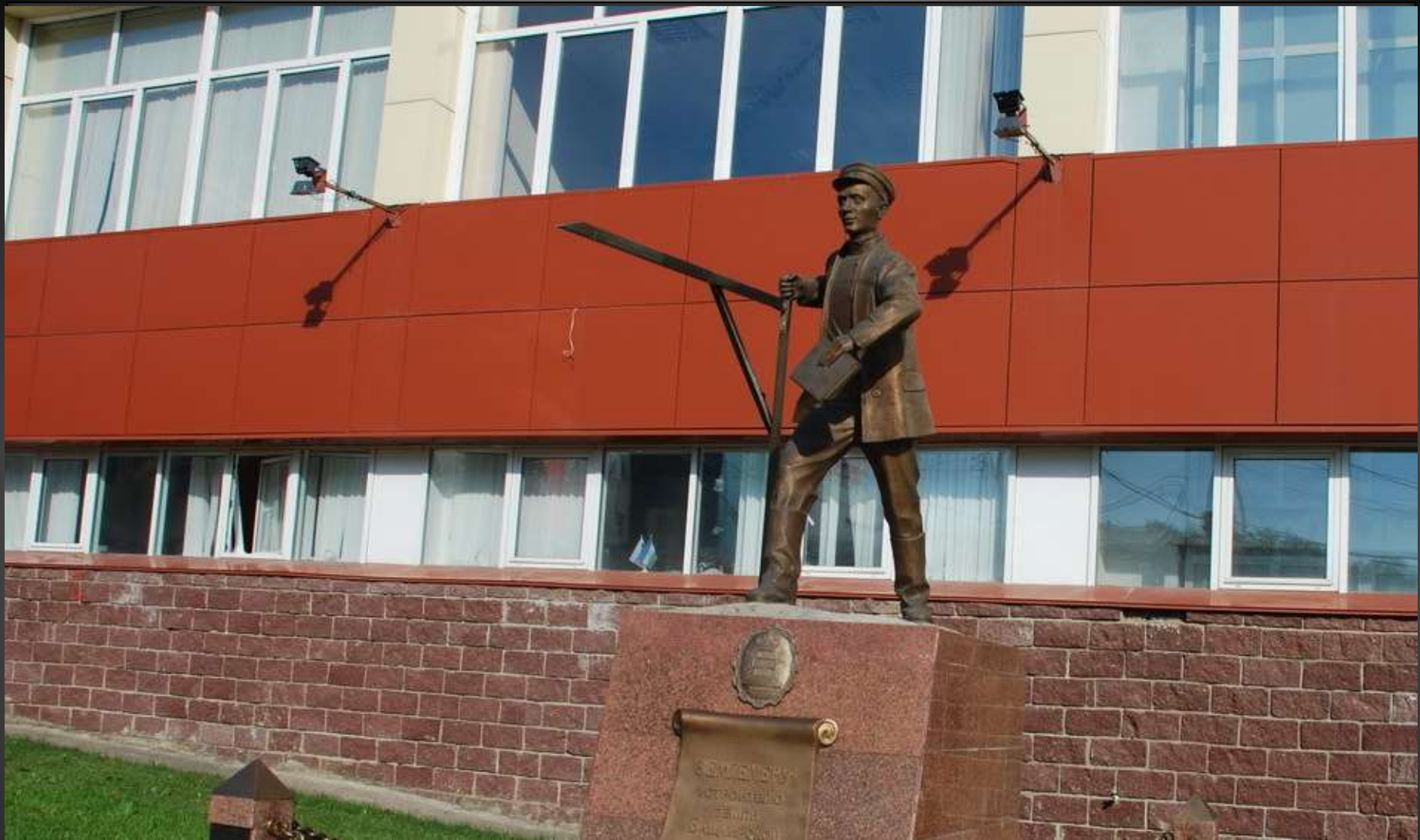
Памятник землемеру в Уфе